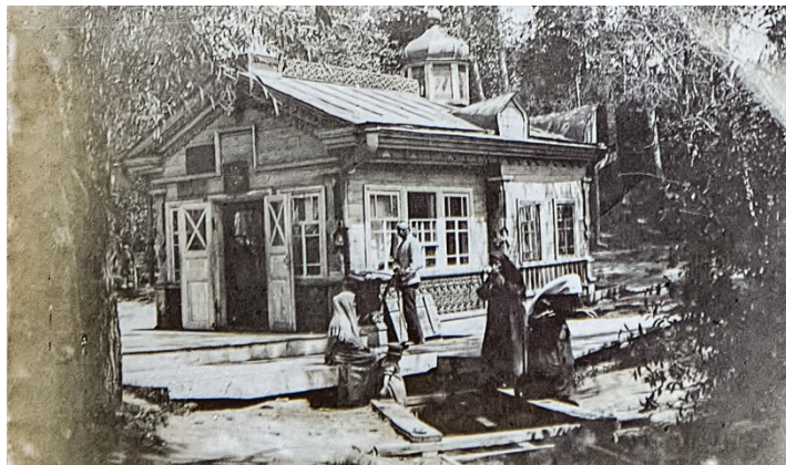
Часовня на Святом Ключе.

служения в женском монастыре на Святом Ключе. Позже, через год, монастырь был распущен (имущество отобрали, а монахинь выгнали), в апреле из церкви монастыря были изъяты (ограблены) ценности, и сразу же на его месте 29 мая 1922 г. открылся дом отдыха «Красный Ключ».