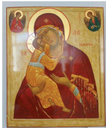
Л. Ключников Владимирская Богоматерь