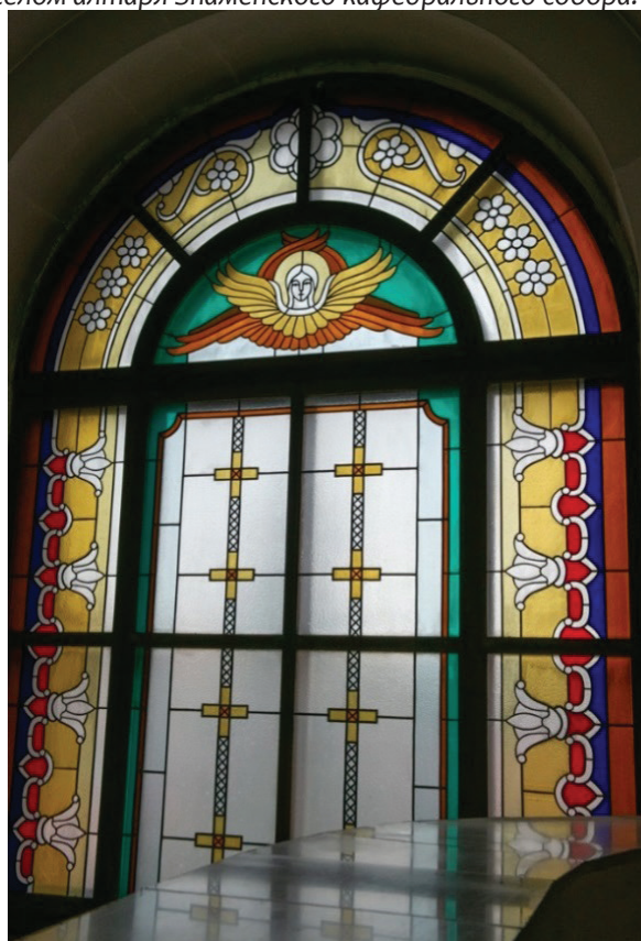
3. Витраж с серафимом притвора Знаменского кафедрального собора. г. Кемерово. 1995 г.