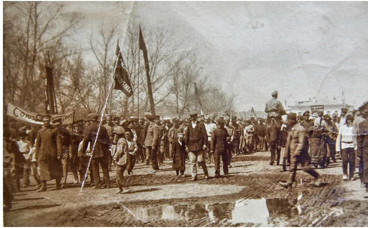
г. Семипалатинск. 1920-е годы.

После октябрьского переворота 1917 г., как и в каждом цивилизованном государстве, судебная власть продолжила свою работу. Дело священника Максимова является своего рода свидетельством того, что человека нельзя было просто так схватить и осудить, ведь новая власть – ни тирания какая-нибудь – она была за справедливость и демократию.