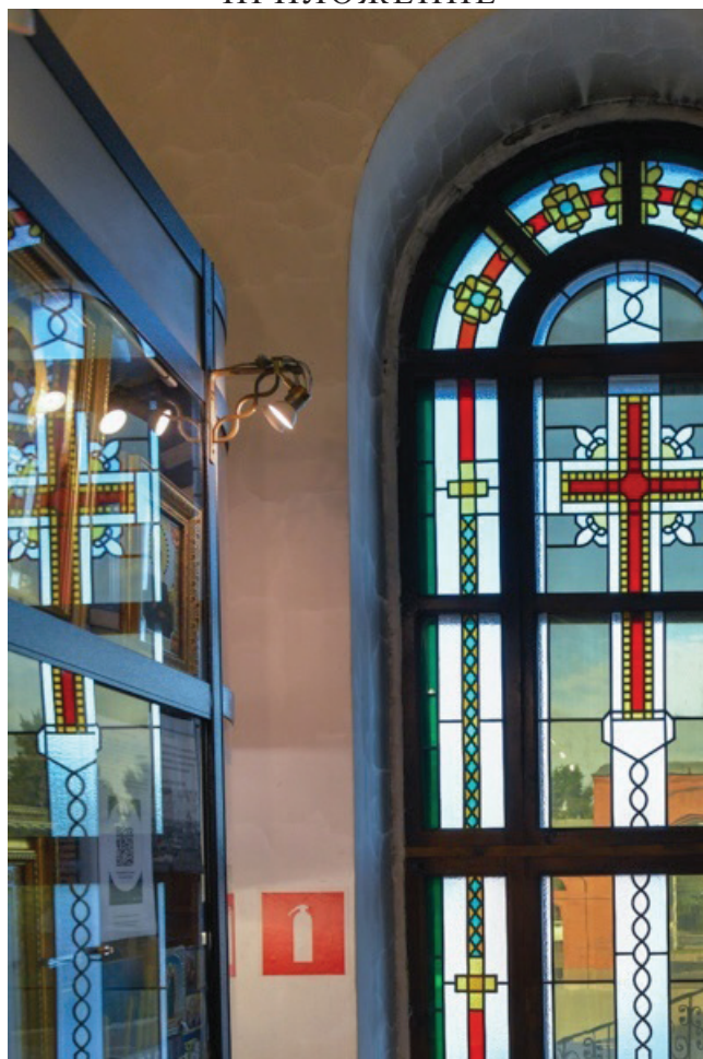
1. Витраж с крестом притвора Знаменского кафедрального собора. г. Кемерово. 1995 г.