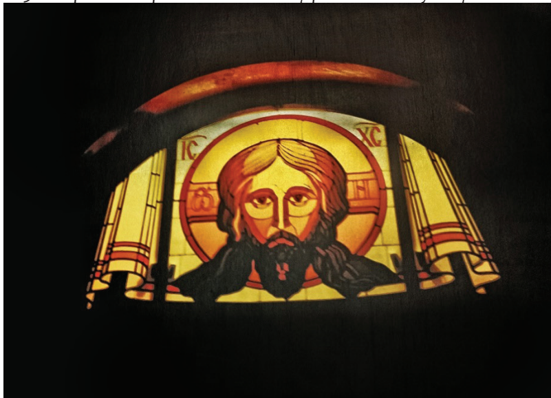
6. Витраж «Спас Нерукотворный». Церковь Великомученика Андрея Критского г. Тайга. 1998 г.