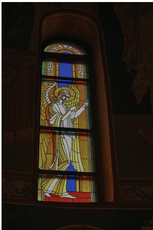
2 Витраж с архангелом алтаря Знаменского кафедрального собора. г. Кемерово. 1995 г.