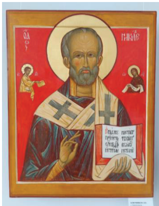
Л. Ключников Св. Николай