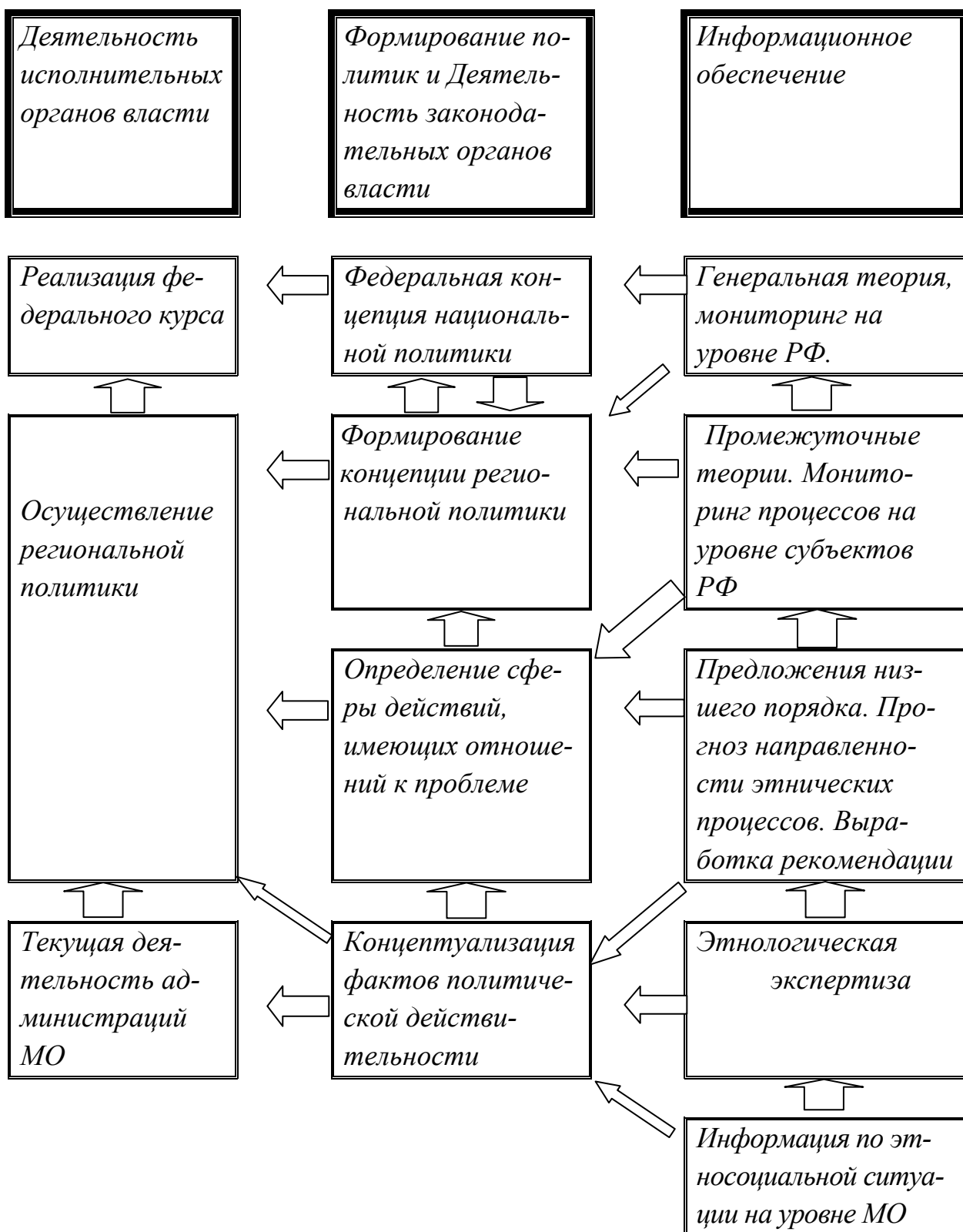
Рис. 1. Модель информационного обеспечения национальной политики