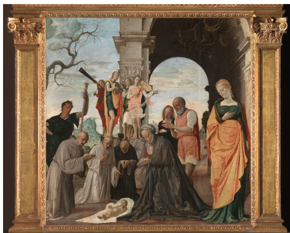
Рисунок 5. Брамантино, «Поклонение Младенцу», 1485. Милан, Пинакотекa Амброзиана