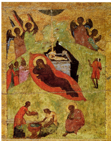
Рисунок 3. Рождество. Из праздничного чина Софийского собора. Ок. 1341. Новгород, Новгородский музей-заповедник