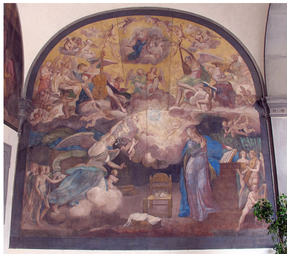
Рисунок 2. Благовещение, внешняя фреска больницы «Санта Мария Нуова», Флоренция