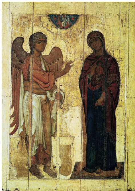
Рисунок 1. Благовещение Устюжское, XII век. Москва, Третьяковская галерея