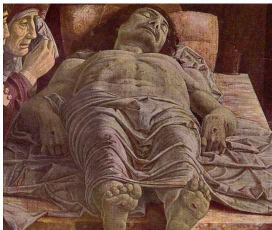
Рисунок 6. Андрея Мантенья, «Оплакивание мертвого Христа», конец XV века. Милан, Пинакотекa Брера