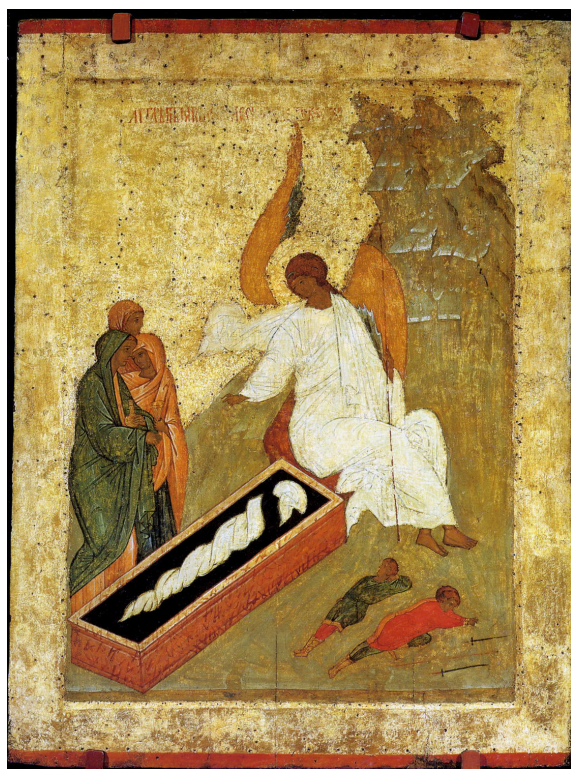
Рисунок 4. Мироносицы у гроба Господня, 1479. Санкт-Петербург, Русский музей