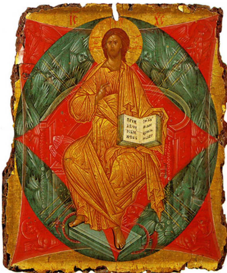
Рисунок 7. Андрей Рублев. Спас в силах. 1408/1410. Москва, Третьяковская галерея