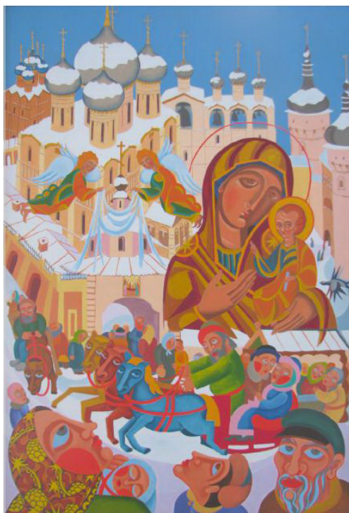
Рисунок 4. Инна Антонова. Покров Богородицы, 2008. Холст, масло, 125 x 86.