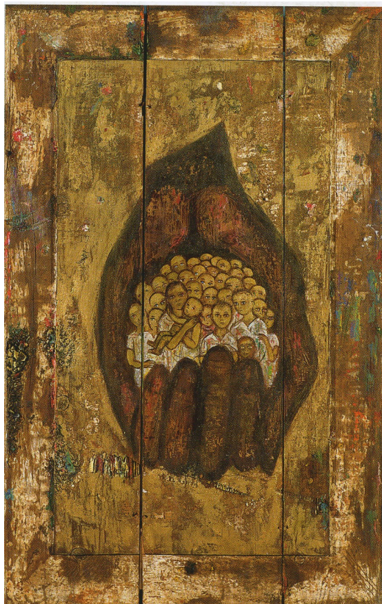
Рисунок 1. А. Камалов. Все мы в руке Божией , диптих, 1997. Доска, левкас, темпера, 80 x 65 (обратная сторона). Музей современного искусства «АРТ-ЭТАЖ».

давать идейно осмысленный конкретный образ, превращающийся в картину...» [6, с. 1]. Таким образом, при выстраивании цветowych пятен, основанных на цветовосприятии и подсознательном ощущении, образуются архетипические сюжеты, затрагивающие христианские символы, цветовой иконописной символики, иконографического типа Богоматери. Через три года художник снова создаст картину «Святое семейство» (2006), в подобной манере и технике, имеющую аналогии и общие черты с первым экспериментальным полотном.