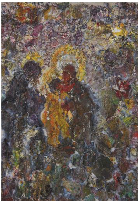
Рисунок 5. В. Гончаренко. Святое семейство, 2003. Оргалит, масло, 50 x 40.

полей. В данном случае, в истории российского искусства стоит обратить внимание на работу Е. Е. Моисеенко (1916–1988) «Сережа» (1973) из собрания Государственной Третьяковской галереи, также на работы приморского художника К. И. Шебеко (1920–2004). Архетип Героя рассматривается через призму героического архетипа Георгия Победоносца, например в работе приморского художника Г. Омельченко (род. в 1936 году). Но в эволюции развития сюжет приобретает психологический аспект, что приводит к середине XX века к появлению портретов героев труда, покорителей стихий природы. Среди художников Центральной России стоит отметить Н. И. Андронову (1929–1998), Г. М. Коржева (1925–2012), в приморском регионе – И. В. Рыбачука (1921–2008) и других. Так, складывается общая система ценностных архетипов в российском искусстве XX–XXI веков.