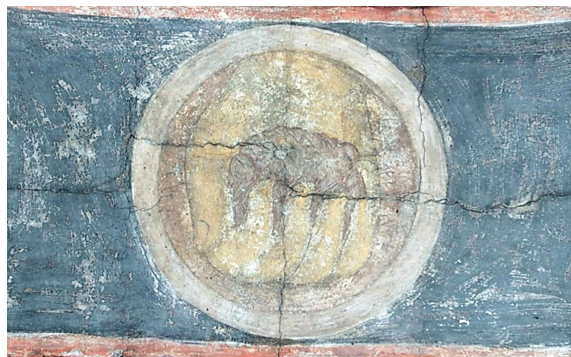
Рисунок 2. Андрей Рублёв. Души праведных в руке Божией . Успенский собор, Владимир, 1408.

Таким образом, архетип Великой матери в художественном творчестве в российском искусстве от середины XX века до 2000-х годов встречается у современных художников, преломляясь в призме иконографического сюжета, ярко выраженного образа материнства, где мать и дитя составляют единое целое в картине. Развитие данного архетипа проходило одновременно в искусстве центрального и приморского регионов. Обращение в приморском искусстве к общим образам-символам не всегда совпадает с датировкой претворения архетипов в художественном творчестве в центральных регионах страны, где эти процессы нередко проходили раньше. В то же время следует отметить, что в целом эти тенденции претворяются в творчестве хронологически одновременно в трех округах – дальневосточном, центральном и сибирском. Предпосылки обращения к образу Великой матери автор статьи находит еще в соцреализме отечественного искусства XX века. Стоит отметить, что современное развитие регионального искусства приводит к использованию целого ряда архетипов, среди которых: Древо жизни, Великая мать, Герой, а также архетипические мотивы: Дороги, Рыбы, Лестницы. Символ дерева прослеживается в живописных работах приморского художника Р. В. Тушкина (1924–2006), сибирского художника Сергея Элояна (род. в 1958 году). В пейзажах русских реалистов XIX–XX веков встречаются мотивы дороги и широких русских